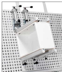
Przedłużki do montażu elementów mebli.