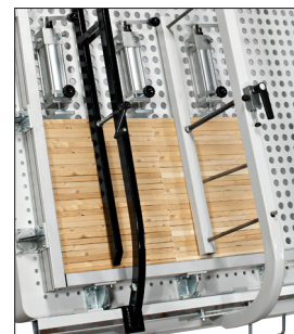
Docisk czołowy stały i przesuwny.