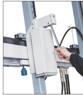
Praktisches System zur Freigabe und Positionierung der Zylinder.