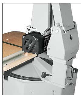
Base del péndulo orientable.